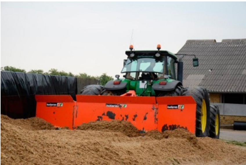
Billede 2. Billedet viser indlægning af majs i tynde lag med dozerblad, hvilket der er god erfaring med.

Fyld ikke siloerne mere end at afgrødemassen kan køres godt sammen helt ud til kanten, og at siderne ikke bliver for stejle. Så er det en bedre løsning, at lægge en del af majs i markstak.